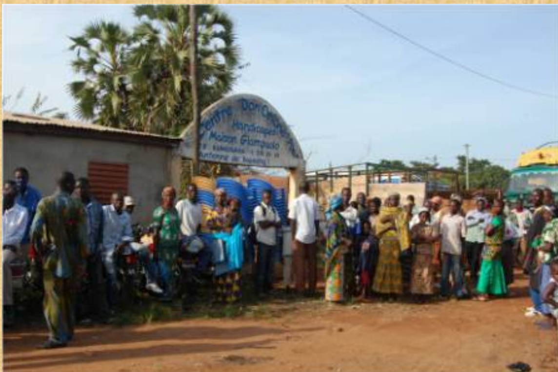
Consulta prequirúrgica en Dapaong

El grupo de profesionales constaba de 2 anestésistas, 1 traumatólogo, 1 cirujano plástico, 1 enfermera, 1 auxiliar y 2 cooperantes. De ellos, los anestésistas, el traumatólogo, la enfermera y la auxiliar son profesionales sanitarios que desempeñan su labor asistencial en el Hospital Virgen de la Salud de Elda, y el cirujano plástico en el Hospital Santa Lucia de Cartagena.